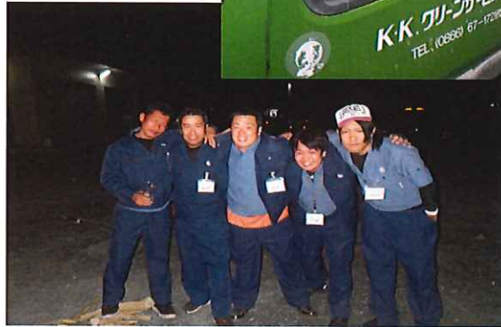
会社のおじさんたちといっしょに